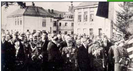
Dom Strzelecki, poświęcenie kamienia węgielnego, październik 1935 r.