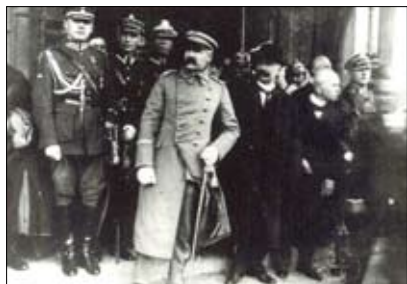
Marszałek Józef Piłsudski w Nowym Sączu, 1921 r.