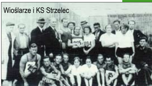
Wioślarze i KS Strzelec