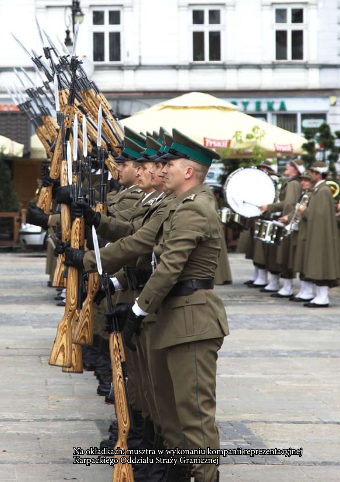
Na okładkach: musztra w wykonaniu kompanii reprezentacyjnej Karpackiego Oddziału Straży Granicznej