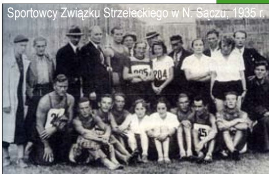
Sportowcy Związku Strzeleckiego w N. Sączu, 1935 r.