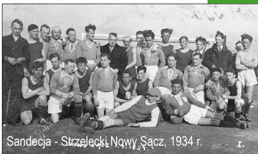
Sandecja - Strzelecki Nowy Sącz, 1934 r.