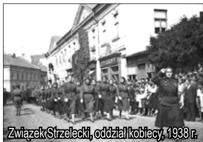
Związek Strzelecki, oddział kobiecy, 1938 r.

W październiku 1935 r. dla uczczenia pamięci gen. Bronisława Pierackiego przy al. Wolności wmurowano kamień węgielny pod budowę Domu Strzeleckiego, który po oddaniu do użytku i poświęceniu w 1937 r. przekazano Związkowi Strzeleckiemu i Związkowi Legionistów Polskich.